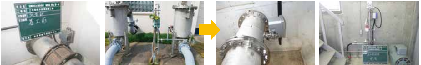
着工前（写真左：流量計、右：圧力伝送器）