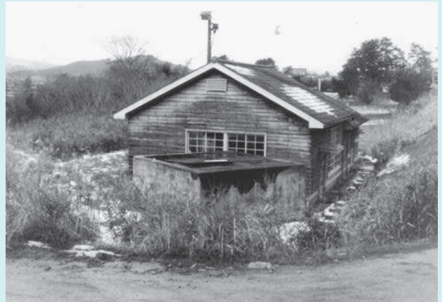
第1揚水機場建屋 昭和32年度造成