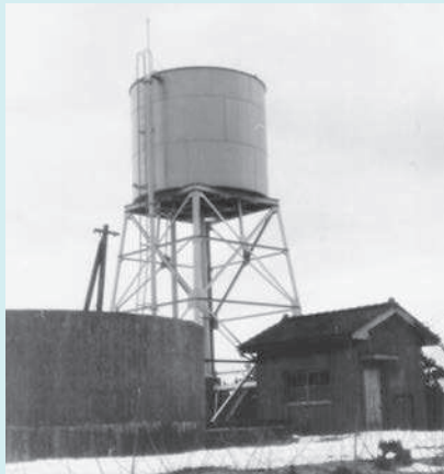
国坂東ポンプ場高架水槽 昭和33年度造成